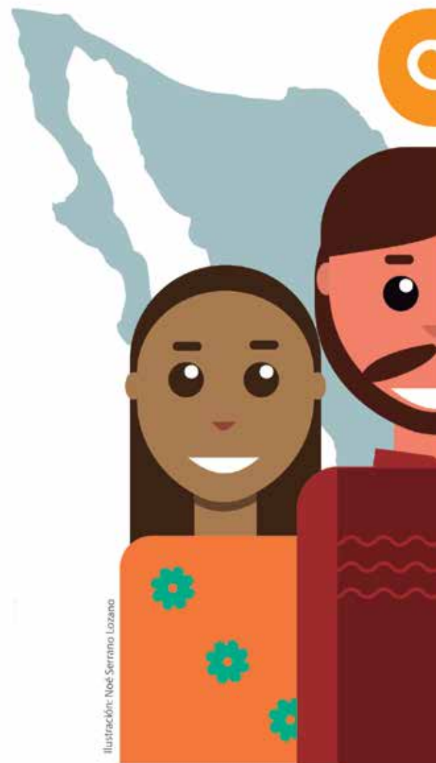
Ilustración: Noé Serrano Lozano

Como se mencionó, las 68 lenguas originarias cuentan con alrededor de 364 variantes de estas, esto es, no es el mismo mixteco que se habla en la Región Mixteca del estado de Oaxaca, que el mixteco que se habla en Puebla, o incluso en San Quintín Baja California, lugar en el cuál existe gran afluencia migratoria derivado de la demanda de mano de obra para actividades agrícolas de se desarrollan en aquellos lares; del mismo modo, no es el mismo náhuatl que se habla en la huasteca veracruzana que la variante del mismo en la alcaldía de Milpa Alta en la Ciudad de México. Esta situación incrementa la problemática para encontrar intérpretes traductores para prestar el debido apoyo en el Sistema Penal Acusatorio (SPA).